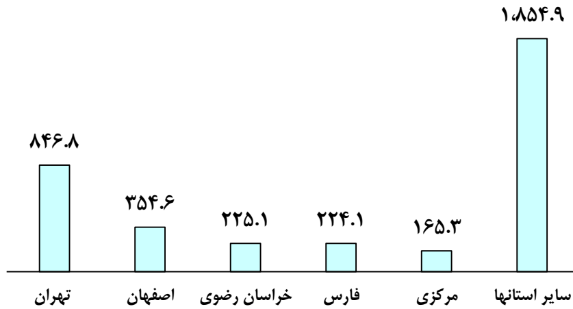
ظرفیت گاوداری‌های صنعتی فعال در سال ۱۳۹۸-هزار راس