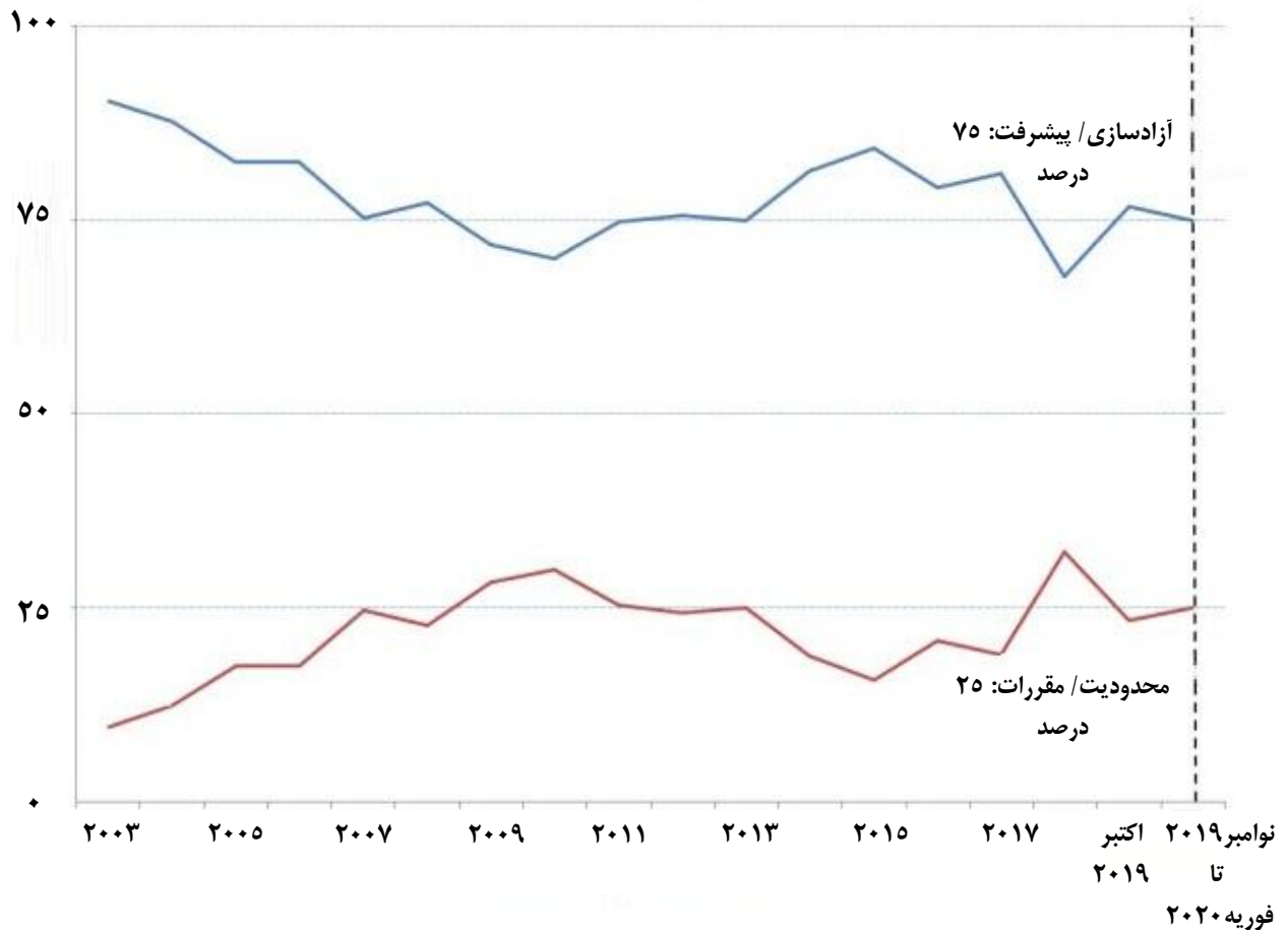
نمودار ۱. روند تغییر در سیاست‌های سرمایه‌گذاری ملی از سال ۲۰۰۳ تا فوریه ۲۰۲۰ (درصد)

با روند بلندمدت سیاست‌گذاری هم‌راستا شده است (نمودار ۱). محدودیت‌ها و مقررات اعمال شده مربوط به انجام سرمایه‌گذاری‌های جدید توسط سرمایه‌گذاران خارجی به طور عمده ریشه در دلایل امنیت ملی در مورد میزان مالکیت خارجی در حوزه زیرساخت‌های مهم، فن‌آوری‌های اصلی یا سایر دارایی‌های حساس دارد. همه این اقدامات توسط اقتصادهای پیشرفته اتخاذ شده است.