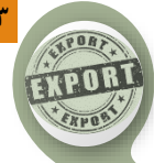
روند ماهانه وزن تجارت کالایی (میلیون تن)

افزایش ۱.۷ برابری ارزش صادرات کالایی غیرنفتی در مهر ۱۳۹۹ (بالاترین رقم طی ۱۷ ماه گذشته)