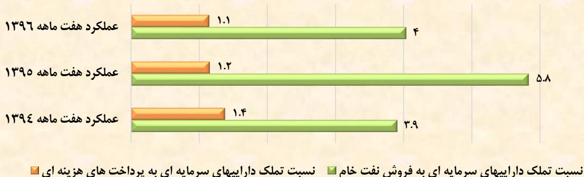
مقایسه نسبت تملک دارایی های سرمایه ای هفت ماهه نخست سال ۱۳۹۴ الی ۱۳۹۶ - درصد