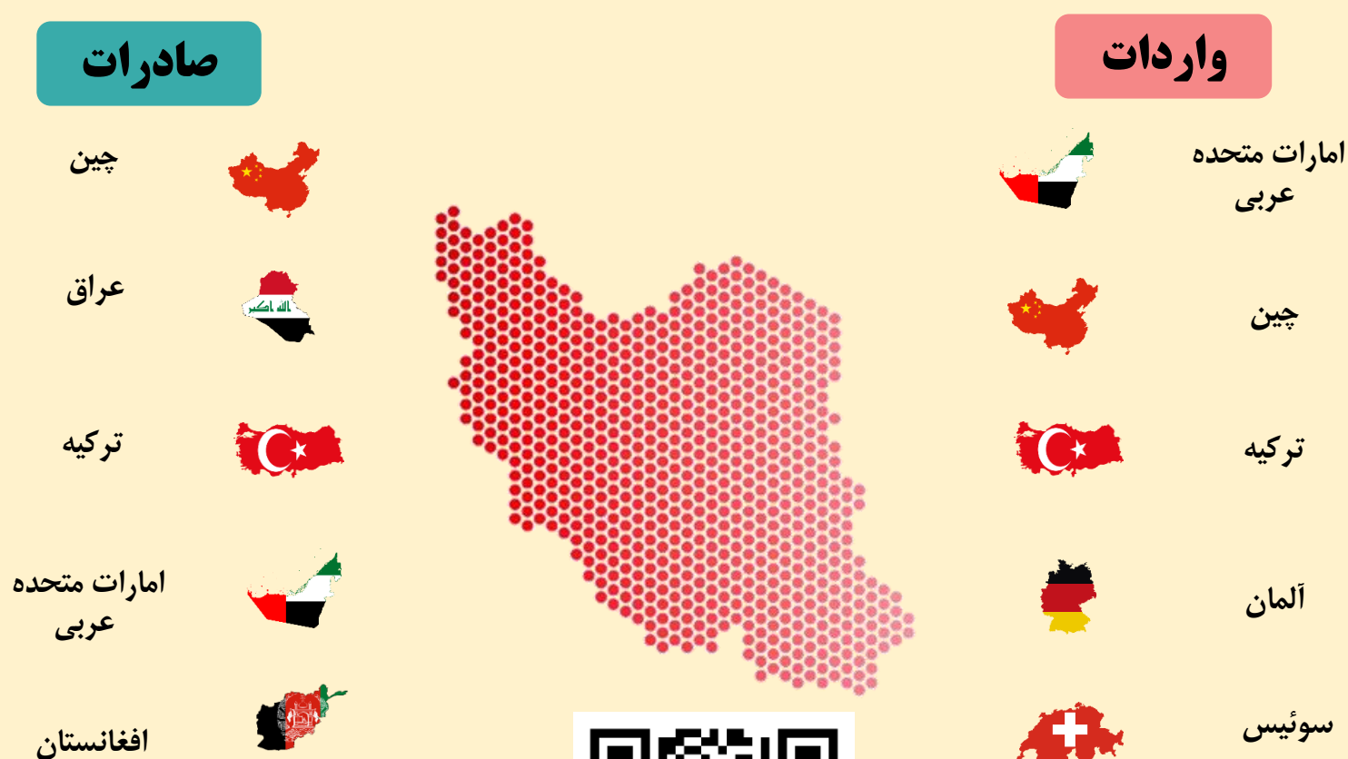
عمده مقاصد صادراتی و مبادی وارداتی ایران طی ده ماهه ۱۴۰۰