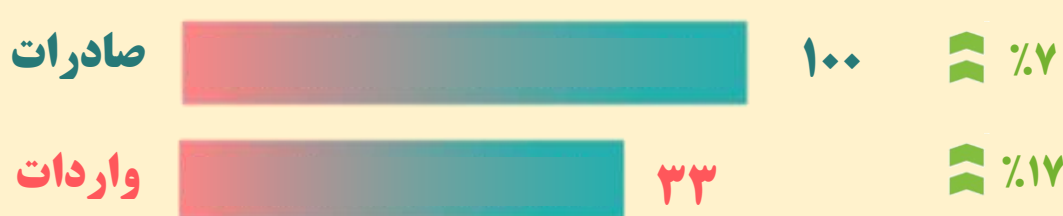
روند ماهانه ارزش تجارت کالای بدون نفت خام - میلیارد دلار